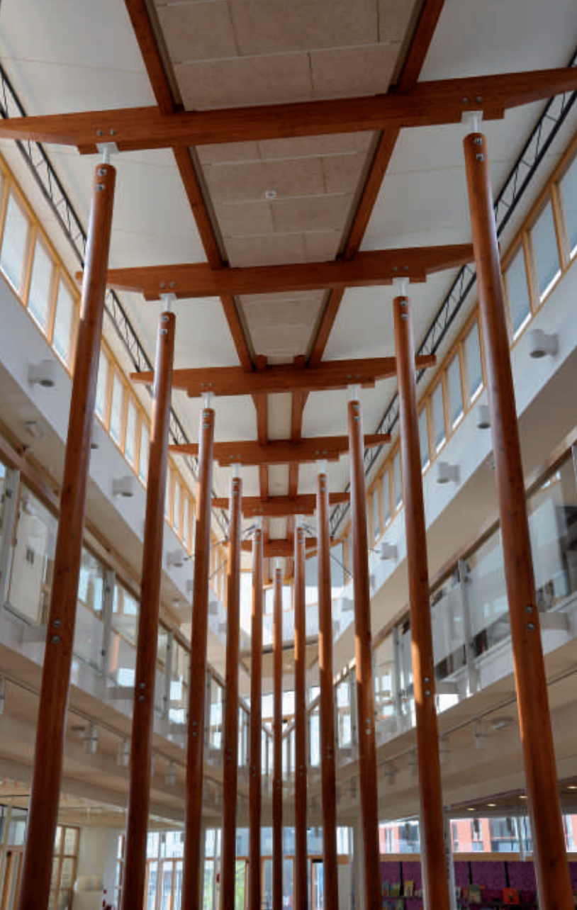
Het vleugeldak wordt bijzonder rijk ondersteund.