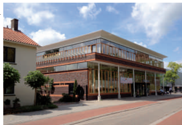
Het spel van materialen en insprongen is aan de straatgevel het rustigst.